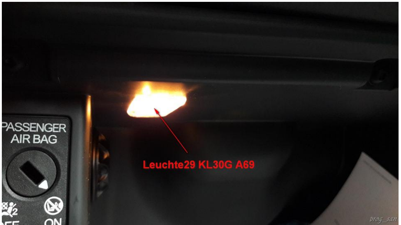
Плафон освещения вещевого ящика