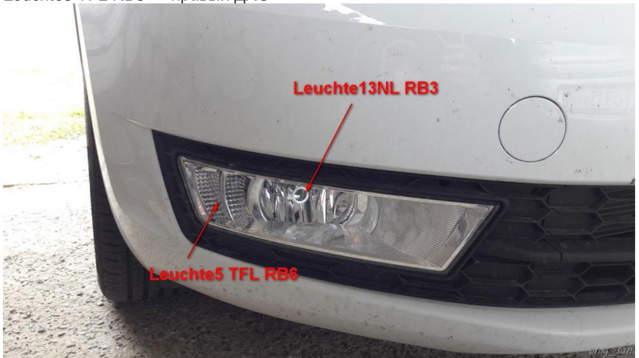
Рисунок 3. Правая ПТФ

Leuchte13NL RB3 — правая ПТФ Leuchte5 TFL RB6 — правый ДХО