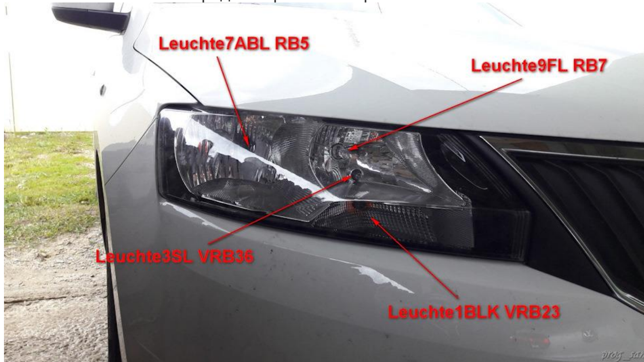
Рисунок 1. Правая передняя фара

Leuchte3SL VRB36 — передний правый габарит