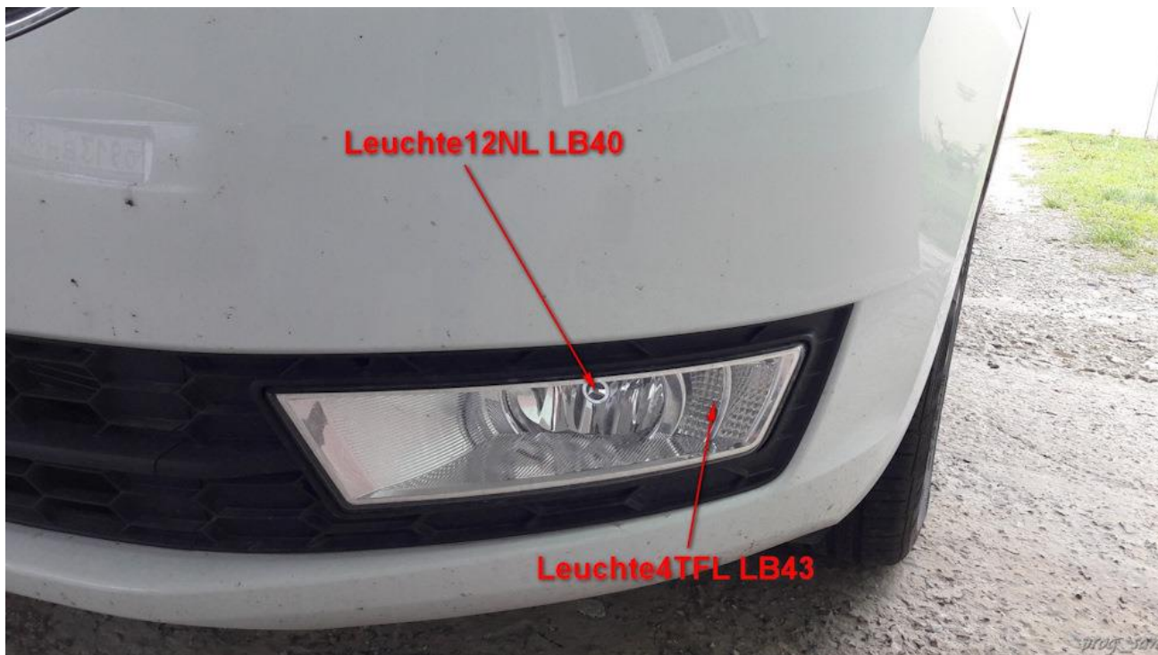
Рисунок 4. Левая ПТФ