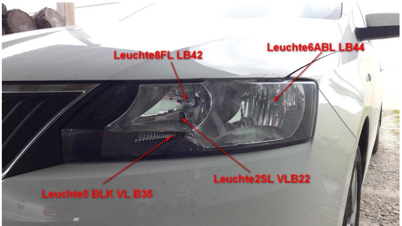
Рисунок 2. Левая передняя фара

Leuchte13NL RB3 — правая ПТФ Leuchte5 TFL RB6 — правый ДХО